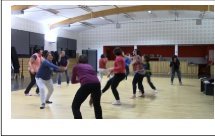
Les corps en mouvement

Après 6 mois et demi d'arrêt... Reprise de l'atelier salle Paul Rouziès à La Bastide l'Evêque.